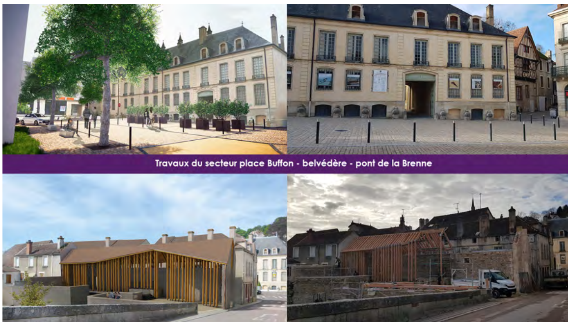
Travaux du secteur place Buffon - belvédère - pont de la Brenne

Avec tout d'abord des chantiers qui transforment le visage de notre ville et valorisent son patrimoine :