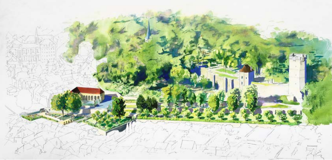
Parc Buffon - Aquarelle / Tout se transforme architectes paysagistes, Arnaud Madelénat illustrateur